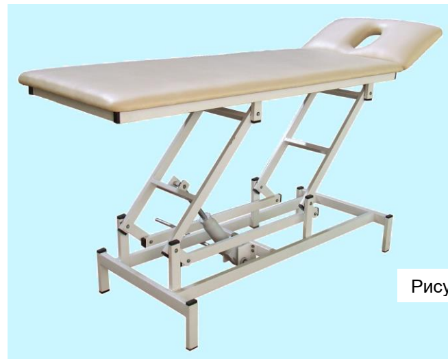
Рисунок 1 – Кушетка многофункциональная КМ-10

среде паров кислот, щелочей и других агрессивных примесей: температура окружающего воздуха от минус 50 до плюс 40 °С; относительная влажность 98 % при 25 °С.