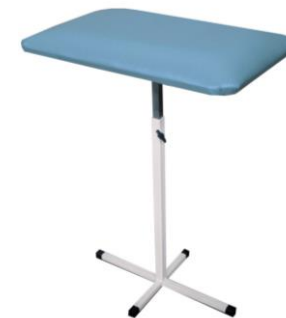
Рисунок 3 – Подставка для руки П-1