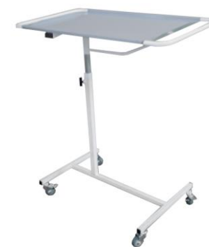
Рисунок 4 – Подставка П-2